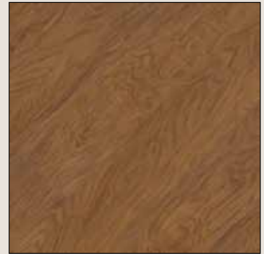
Antique Brushed Oak